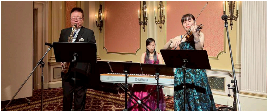
リーブルミュージックのみなさま