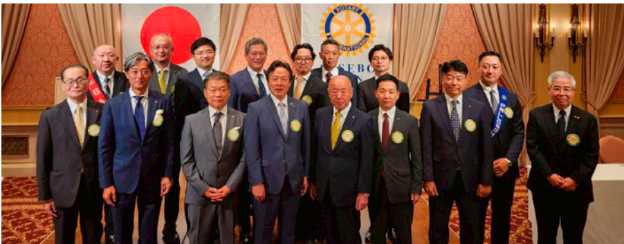
新役員・理事・監事紹介