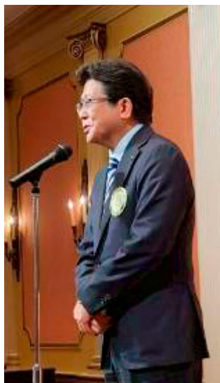
来賓挨拶 宮島 大典 市長