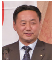
来賓挨拶 名誉会員 海上自衛隊佐世保地方總監 西 成人 様