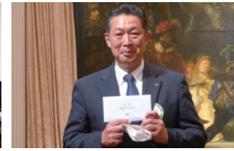
役員交代式記念ゴルフ大会表彰