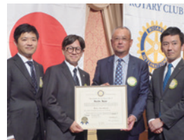
新会長 副会長 幹事 副幹事