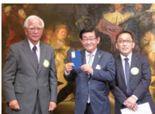
役員交代式記念団基・将棋大会表彰