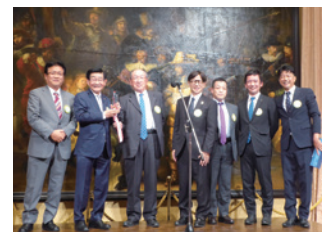
役員交代式記念健康麻雀大会表彰