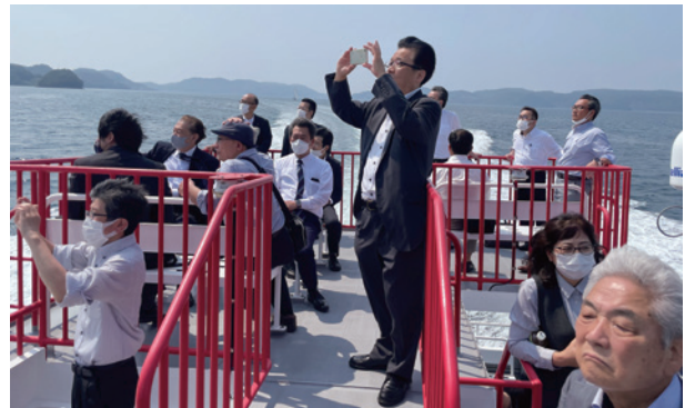
久しぶりに潮風を体一杯に受け、心身ともにリフレッシュできました。