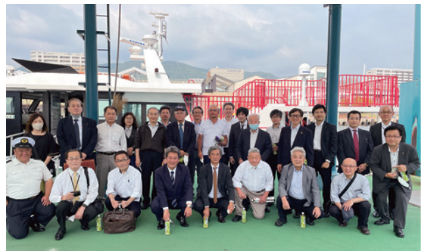
天気にも恵まれ最高でした。