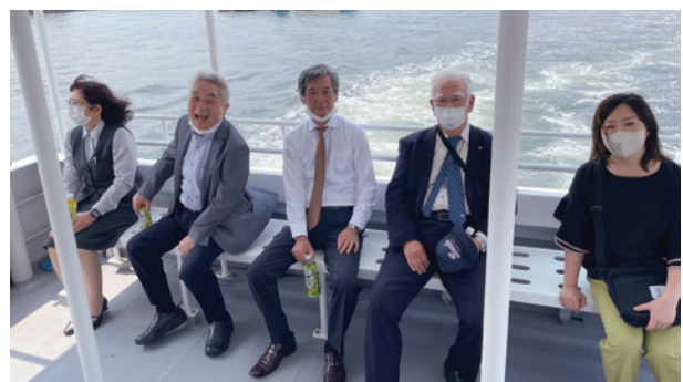
またの機会を楽しみにしております。