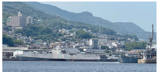
日米とも珍しい艦船が入港しておりシャッターチャンスがたくさんありました。