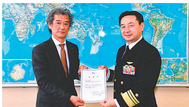
3月30日海上自衛隊佐世保地方總監 西成人様