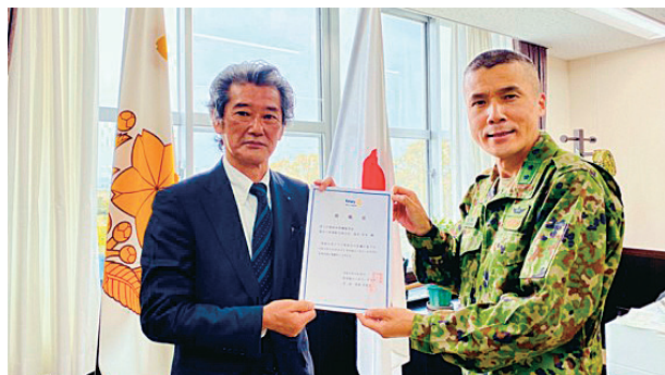
3月28日陸上自衛隊 水陸機動団長兼相浦駐屯地司令 梨木信吾様訪問