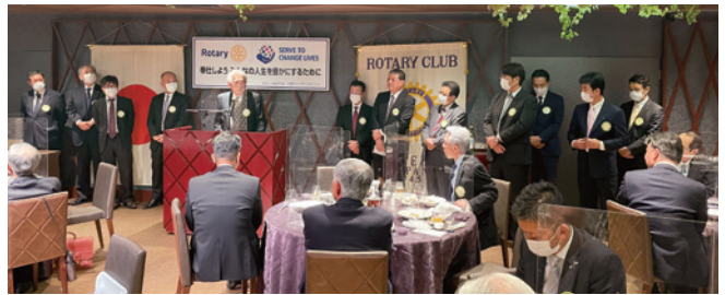
新会員 研修感想発表