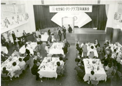
1976-77年 7階会場 忘年家族会