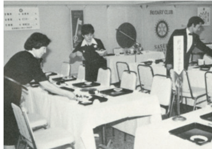
例会を支えてくださったみなさま