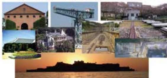
2015年世界文化遺産：明治日本の産業革命遺産長崎ストーリー

最も注目を集めた『軍艦島』を活用して、いかにして長崎のこの資産を伝承、語り継ぎ、遺して行くのか？ 世界遺産とは我々が背負った責任でもある。