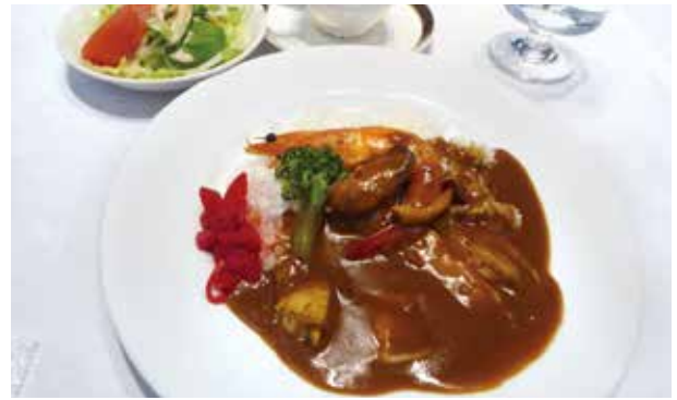
【本日のランチ：シーフードカレー】 甘すぎず辛すぎず魚貝の風味ただよう 美味しいカレーでした。