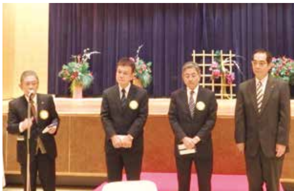
賀寿をお迎えになられた皆さん 益々のご清祥ご活躍をお祈りします