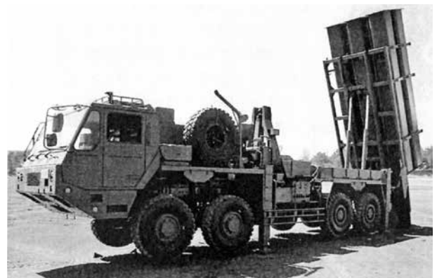
12式地对艦ミサイル。南西諸島に複数配置すれば全域をカバー可能

■安上がりな抑止目指す「オフセット戦略」とは 米国では財政上の要請等から、資源をコアコ ンピタンスに集中し相手の優位性を相殺するこ とで、経済的に相手を抑止するという「第3の オフセット(相殺)戦力」が注目されている。