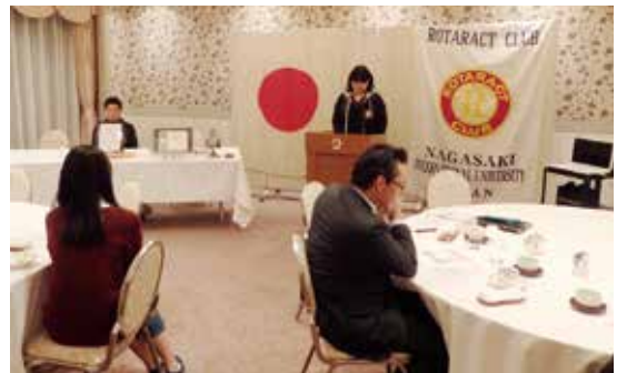
11月10日(木) 長崎国際大学RAC例会のようす