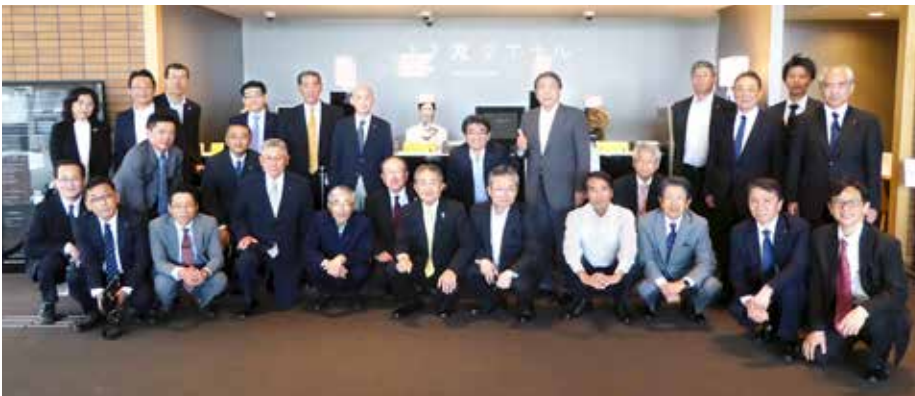
ハウステンボス「変なホテル」にて

日時/2016年5月11日(水) 場所/ハウステンボス・技術センター(株) 参加人数/30名