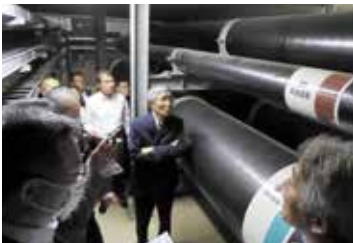
共同溝(地下トンネル)見学

ハウステンボス・ 技術センターと九 電工共同による、 太陽光と風力を 用いた「ハイブリ ッド発電制御シス テム」の見学