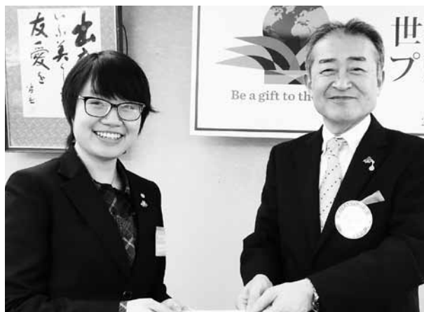
会長より奨学金の授与