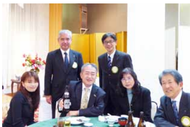
創立65周年記念式典実行委員会