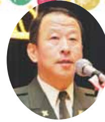
名誉会員挨拶・乾杯 西部方面混成団長兼 相浦駐屯地司令 杉本嘉章 様