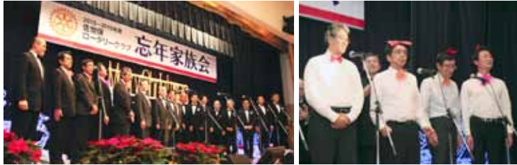
佐世保RC男声合唱団