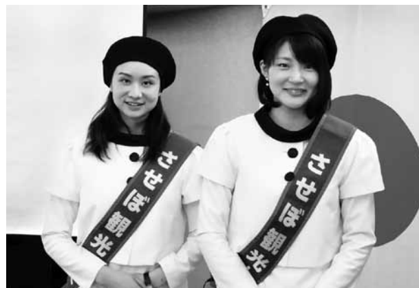
ミス佐世保→サンメールさせぼ→させぼ観光大使と2011年に名称変更。

させぼ観光大使は、長崎県佐世保市のPR活動を行うのが主な目的です。2年間の任期で、観光大使としては、2015年度で三期目です。