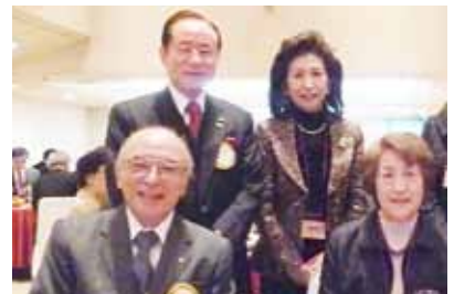
2014年12月13日 忘年家族会にて