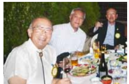
2014年9月10日 観月例会にて

ロータリー財団 1981年~ 4,100ドル (公)ロータリー米山記念奨学会 2004年4月~ 300,000円 佐世保RC国際交流基金 1989年~ 96,250円