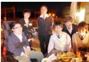
長崎国際大学RACと 西海学園高校IACのみなさん