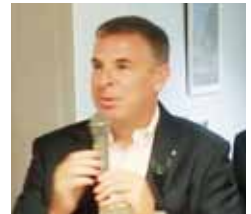
乾杯 名誉会員 米海軍佐世保基地司令官 マシューD.オヴィアス様