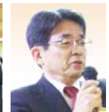
恒例の「手に手つないで」の斉唱