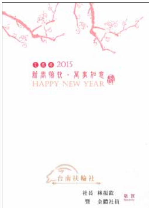
台南ロータリークラブから届いた年賀状