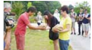
官氏より学生へお米の贈呈