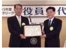
前年度会長、幹事へ感謝状の贈呈 「お疲れ様でした」