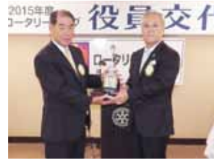
会長バッジ及び鐘の伝達