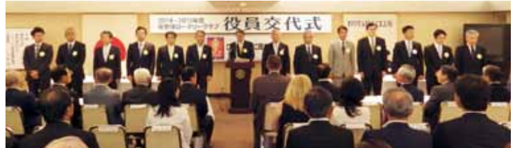
新役員、理事並びに監事紹介