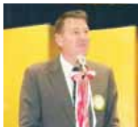
ご挨拶 名誉会員 米海軍佐世保基地司令官 チャールズW. ロック 様