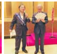
役員交代式記念ゴルフ大会表彰