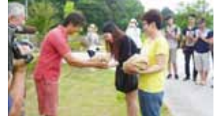
官氏より学生へお米の贈呈