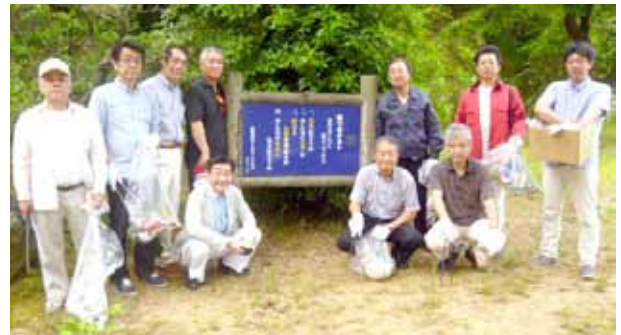
平成26年6月1日 空き缶回収キャンペーン

最後に悩み事がある場合は、専門家に早期に相談されるといいと思います。何らかの問題解決のヒントがあるかもしれません。