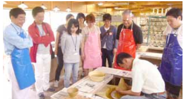
平成26年6月1日 長崎国際大学RAC第100回記念例会 陶芸体験 陶芸の館「くらわん館」にて