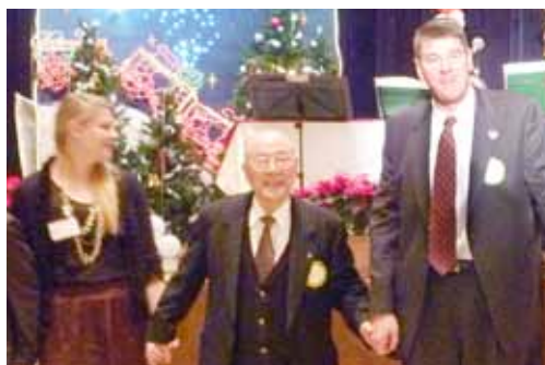
2011年12月17日 忘年家族会にて

ロータリー財団 1973年~ 3,000ドル （財）ロータリー米山記念奨学会 1980年 300,000円 佐世保RC国際交流基金 1988年 1,000,000円