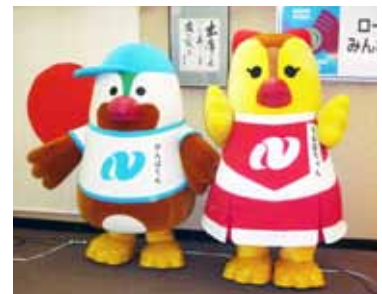
「がんばくん」と「らんばちゃん」