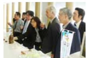
大島酒造(株)で試飲