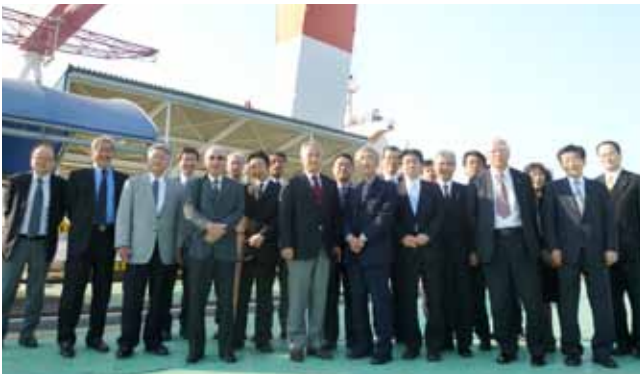
(株)大島造船所にて

と き：平成26年4月23日(水) 例会後～ と ころ：(株)大島造船所、大島酒造(株) オリーブベイホテル