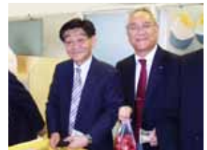
大島トマトを購入