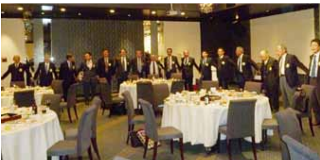
恒例の「手に手つないで」の斉唱の後、お開きとなりました。