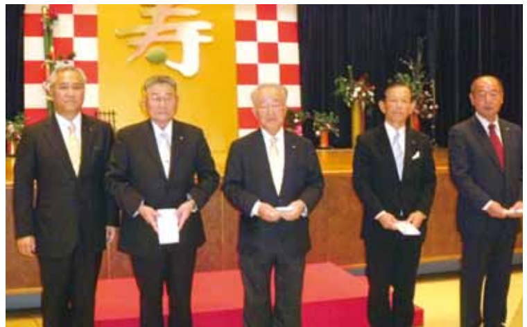
賀寿を迎えられた皆さん