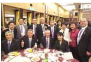
大変楽しく盛り上がった記念懇親会にて