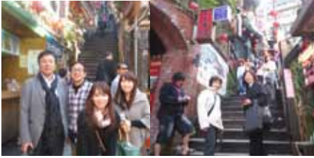
千と千尋の神隠しのモデルとなった九份(きゅうふん)の街並み