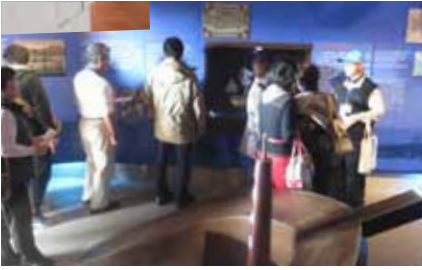
熱蘭遮城博物館 安平古堡 (あんびん こほう) 鄭成功がオランダから奪還した当時の様子が学べる博物館