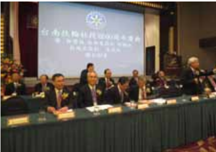
台南扶輪社創立60周年慶典 式典