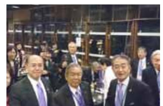
リーダーさんを囲んで、楽しい2次会でした。