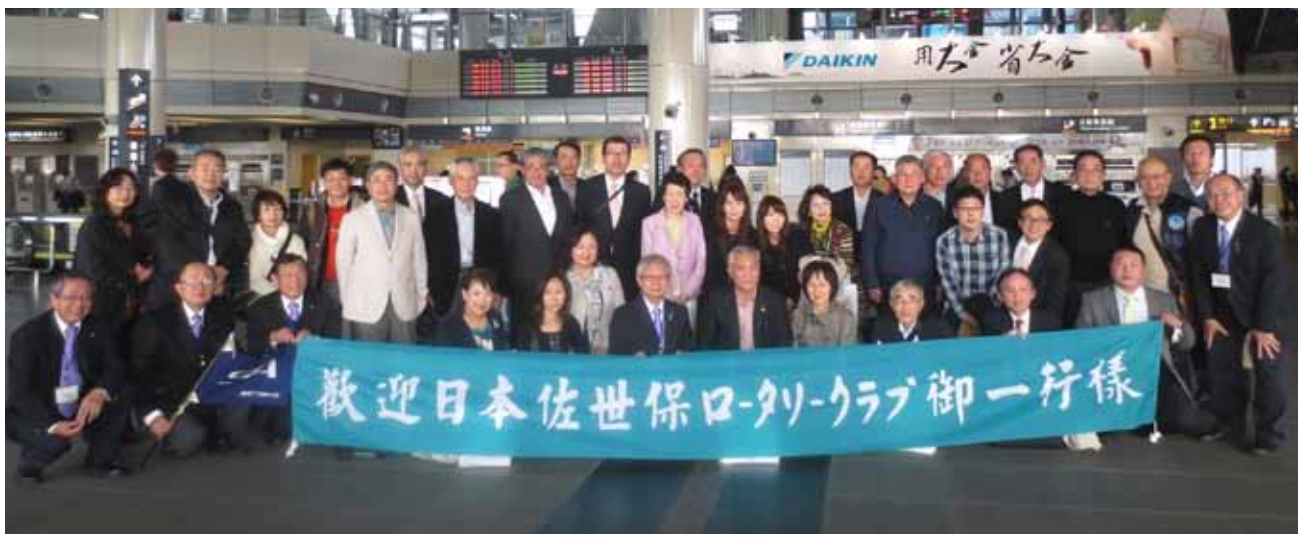
新幹線の台南駅に、台南扶輪社の方々が出迎えに来てくださいました！