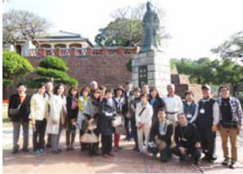
鄭成功の銅像の前で記念写真