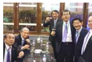
2次会で盛り上がるメンバー