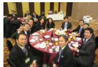
台南扶輪社の皆様に、心をこめたご接待をいただきました！