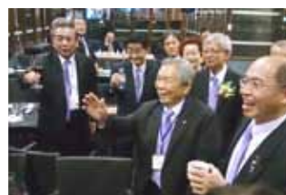
台南扶輪社の重鎮 リーダーさん(昭和8年生まれ)が2次会のホスト役を務めてくださいました。