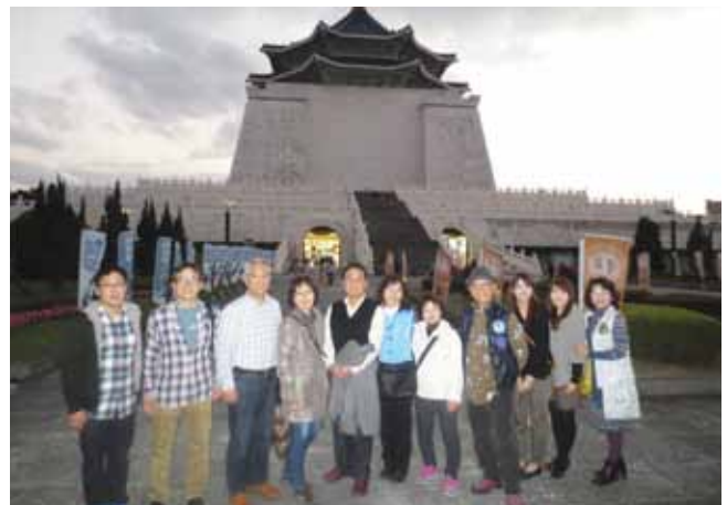
蒋介石の偉業を讃える「中正紀念堂」を見学