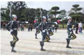
忠烈祠(ちゅうれつし) 衛兵交代式見学