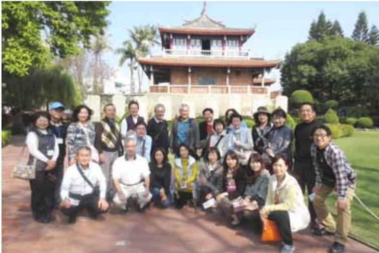
オランダが築城したという旧蹟「赤崁楼」(せきかんろう)を見学

塩のもつ「魔除け、清める」という意味あいと、365日それぞれの「誕生日の色占い」を、組み合わせた、365種類の塩。ディスプレイしたコーナーは、壮観な眺め。