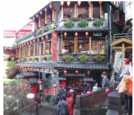
ここが、千と千尋の神隠しのモデルとなった九份(きゅうふん)の阿妹茶楼