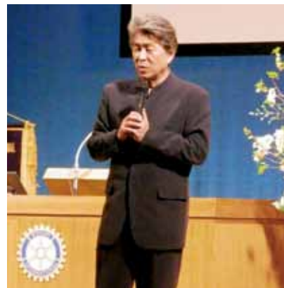
地区大会特別講演 鳥越俊太郎氏