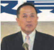
来賓挨拶 名誉会員 海上自衛隊佐世保地方総監 吉田正紀様