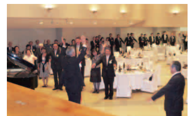
いよいよ2012～2013年度のスタートです!