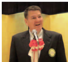
乾杯 名誉会員 米海軍佐世保基地司令官 チャールズ W.ロック様