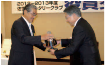
会長バッチ及び鐘の伝達