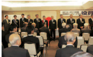
新役員、理事並びに監事紹介