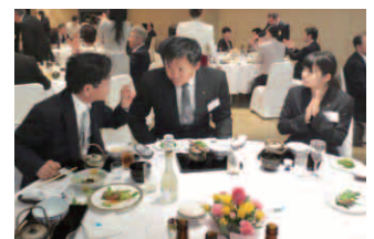
長崎国際大学RACメンバーも参加