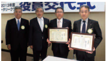
前年度会長、幹事へ感謝状の贈呈 「お疲れ様でした」