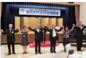
手に手つないでつくる友の輪…