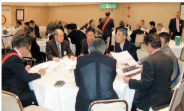
姉妹クラブ歓迎部会