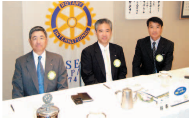
会長、幹事、副幹事 1年間お疲れさまでした