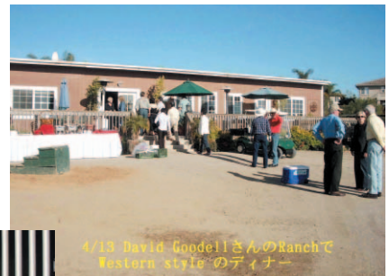
4/13 David GoodellさんのRanchで Western style のディナー