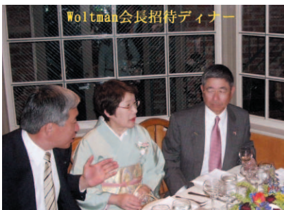
Woltman会長招待ディナー