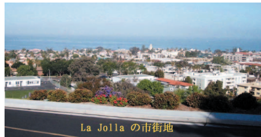
La Jolla の市街地